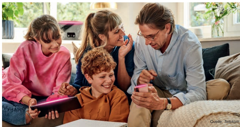
Für rund 1.270 Haushalte in Ortsgebiet Nünchritz baut die Telekom gemeinsam mit der GlasfaserPlus das Breitbandnetz aus.

Gut zu wissen: Die Glasfaser-Tarife der Telekom bieten viel Bandbreite zum fairen Preis. Dabei profitieren