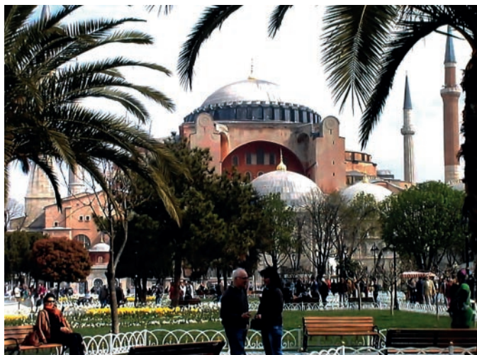
Abb. Hagia Sophia

Ich erwähnte in meinem letzten Beitrag bereits, dass ich 2013 die Verbindung zur Fachgruppe Botanik und Gartenkultur in Dresden fand. Die in dem Jahr genutzte Busexkursion nach Litauen war nicht nur eine Reise schlechthin, sondern eine Bildungsreise höchster Qualität. Im folgenden Jahr 2014 fand ich Gefallen an dem Angebot des Tourismusministeriums der Türkei. Es bestand in einem Angebot zu einer Bildungsreise von Istanbul bis Antalya mit einem Zusatz für eine Woche Hotelaufenthalt am Mittelmeer bei Side. Der Reiseleiter, ein in Köln aufgewachsener junger Mann, verstand es, uns nicht nur zu bekannten Orten wie Istanbul die Stadt am Bosphorus (Abb. Hagia Sophia) zwischen Schwarzem und Marmarameer oder Troja, Pergamon, Ephesos, Pamukale und Antalya zu begleiten, nein der vermittelte die Geschichte und Gegenwart seines Landes. Schon bald nach der Heimkehr war ich wieder mit der o.g. Gruppe aus Dresden unterwegs zur Bundesgartenschau (BUGA) im Havelland (Abb. 1889). Von einem Quartier in einem dortigen Dorf aus starteten wir verschiedene Tagestouren nach Brandenburg, Premnitz, Havelberg und Neustadt an der Dosse. Unser Reiseleiter war aber wieder so gut vorbereitet, dass nicht nur die Blumenschauen, Parks und